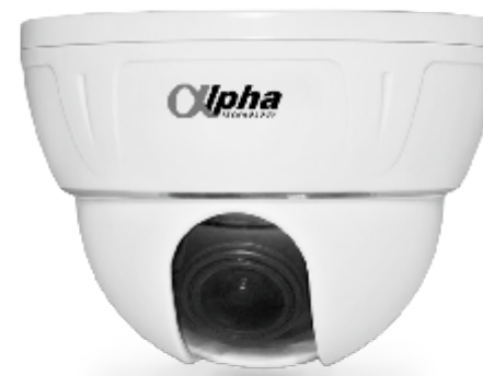
Купольная АHD видеочамера